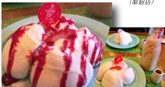
milkのかまくらシフォンケーキ。ソースはお好みで。 (原宿店)

Eggs'n Things のパンケーキ。 日本で食べるのが1番美味しいそうです。