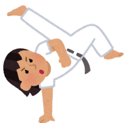
ブラジルで生まれたカポエイラ