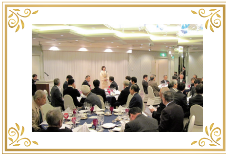
平成 30 年 1 月 新年互礼会